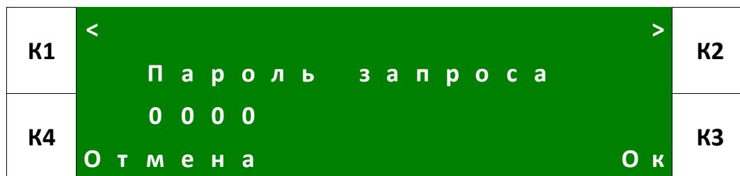
Рис. 13. Пример экрана «Пароль запроса».

• «Пароль запроса» позволяет установить пароль, который должен стоять в начале текста SMS с запросом о состоянии аппарата. Это сделано для того, чтобы не отправлялись несанкционированные ответы на случайные SMS, пришедшие на номер аппарата.