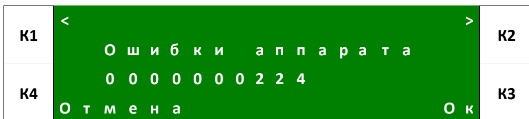
Рис. 14. Пример экрана «Ошибки».

Ошибки бывают критическими и некритическими. При критических ошибках происходит блокирование аппарата, и дальнейшая работа с ним невозможна до устранения и сброса ошибки. При некритических ошибках блокировки аппарата не происходит.